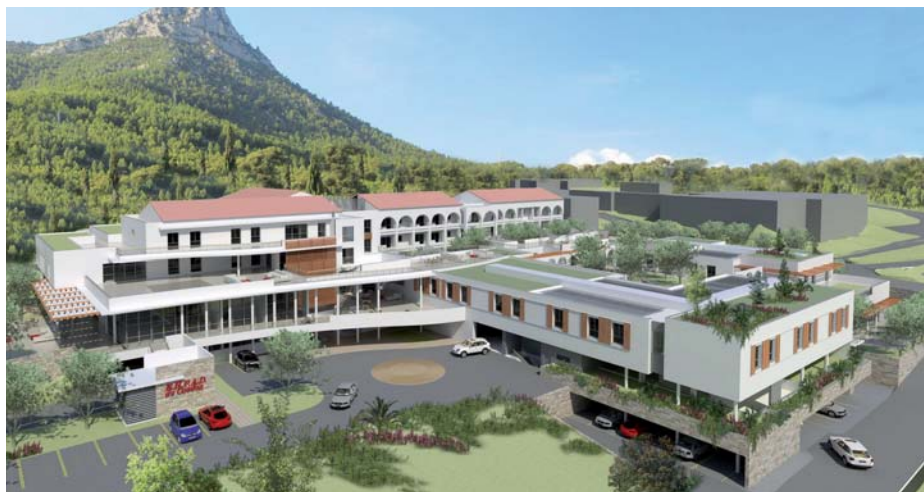
L'EHPAD Résidence Colonel Picot, ouvert en 2015.

Aujourd'hui l'association intègre les militaires blessés des Opérations extérieures