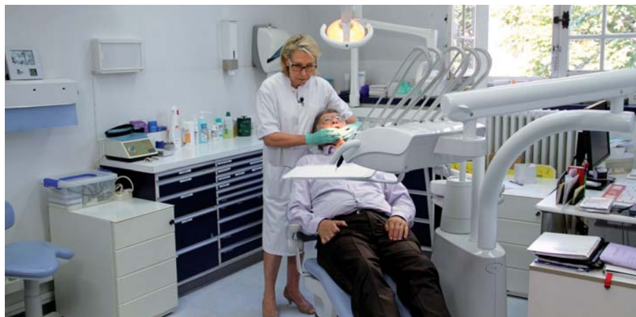
Cabinet dentaire de l'Institution Nationale des Invalides.