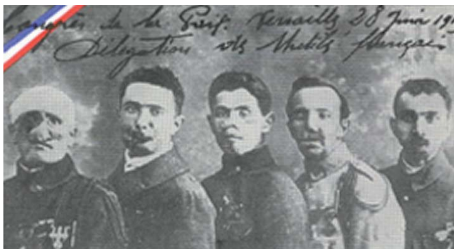
5 mutilés ayant participé à la signature du traité de Paix de 1919.

90 ans plus tard en 2015, les « Gueules Cassées » se sont à nouveau lourdement investis, aux côtés des autres associations de victimes de guerre et d'anciens combattants composant le Comité d'Entente élargi, dans les travaux de refonte du Code des Pensions Militaires d'Invalidité dont la parution est prévue courant 2016.