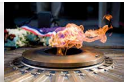
Le devoir de mémoire fait partie des missions statutaires de l'UBFT.