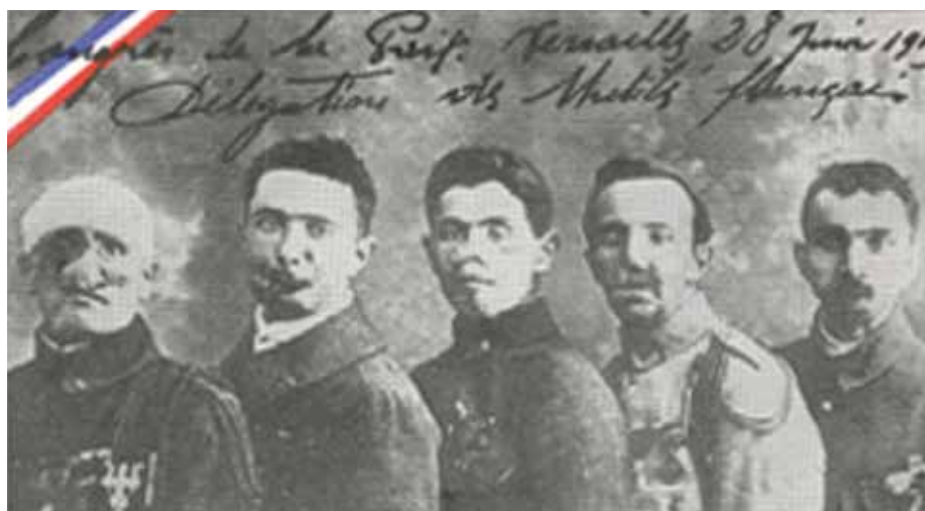
5 mutilés ayant participé à la signature du traité de Paix de 1919.

90 ans plus tard en 2015, les « Gueules Cassées » se sont à nouveau lourdement investis, aux côtés des autres associations de victimes de guerre et d'anciens combattants composant le Comité d'Entente élargi, dans les travaux de refonte du Code des Pensions Militaires d'Invalidité dont la parution a eu lieu le 1 er janvier 2017. Un code annoté est en cours de construction : http://code.pensionsmilitaires.com .