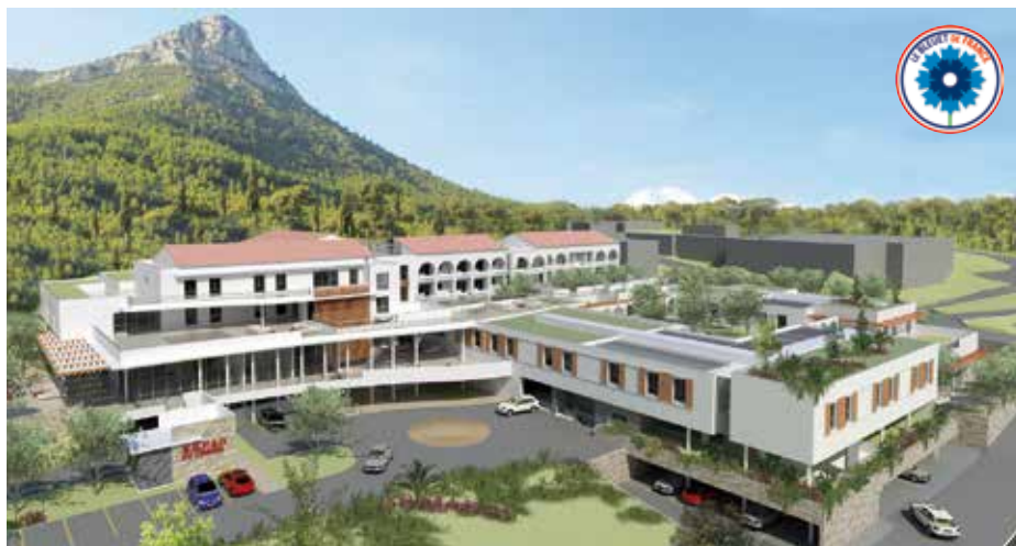
L'EHPAD Résidence Colonel Picot, ouvert en 2015.

L'UBFT a accueilli les blessés, à la face et à la tête, de tous les conflits dans lesquels l'armée française a été engagée, Seconde guerre mondiale, guerre de Corée, d'Indochine, d'Algérie.